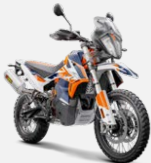
KTM 790 Adventure R MY20