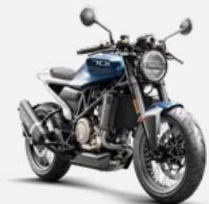
HUSQVARNA Vitpilen 701 MY20