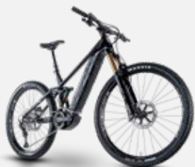
HUSQVARNA MOUNTAIN CROSS 7