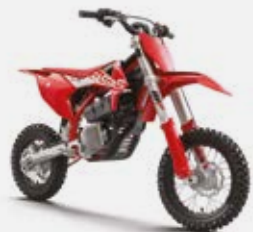
GASGAS MC-E 5 MY21